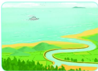
■ rộng mênh mông.