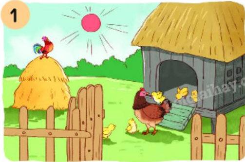
1 Sáng tinh mơ, gà mẹ (...).

Câu 11: Nói tiếp câu kể lại sự việc trong tranh.