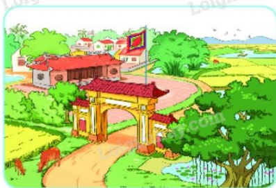
Xóm làng bình yên