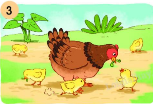
3 Gà mẹ dẫn con đi (...).