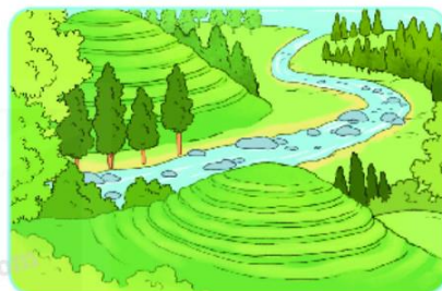
■ núi có ruộng bậc thang.