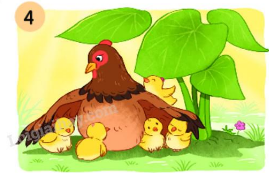
4 Buổi trưa, gà mẹ và đàn con (...).