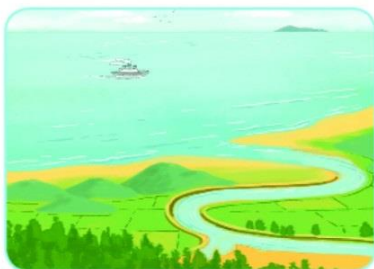
Biển rộng mênh mông