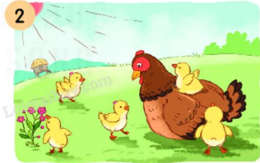
2 Gà mẹ cho đàn con (...).