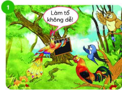
Thầy giáo phượng hoàng ...

b. Kể từng đoạn của câu chuyện theo tranh và từ ngữ gợi ý dưới tranh