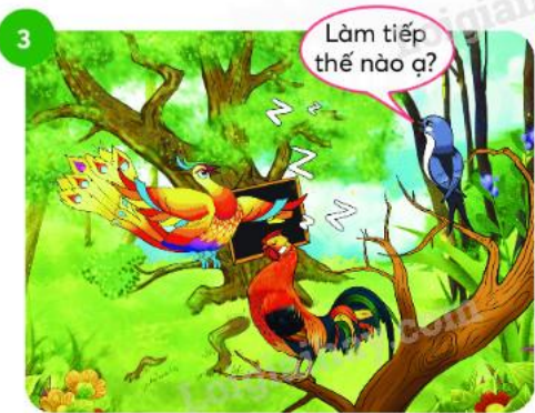
Khi phượng hoàng tiếp tục giảng giải, chim én ...