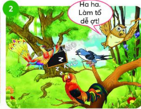
Khi phượng hoàng nói cần tìm nơi làm tổ trên cây, chú ...