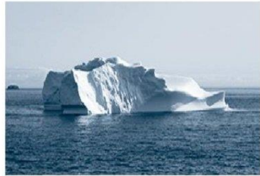
Hình 16.4. Băng trôi ở Gron-len (Greenland)