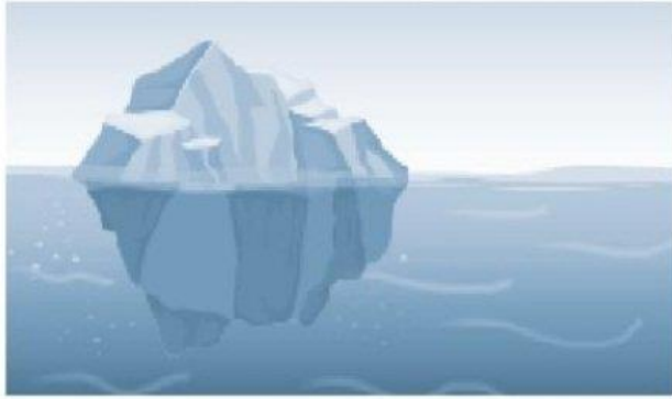
Hình 16.3. Mô hình băng trôi

Quan sát hình 16.3, 16.4, em hãy hoàn thành sơ đồ ở trang bên.