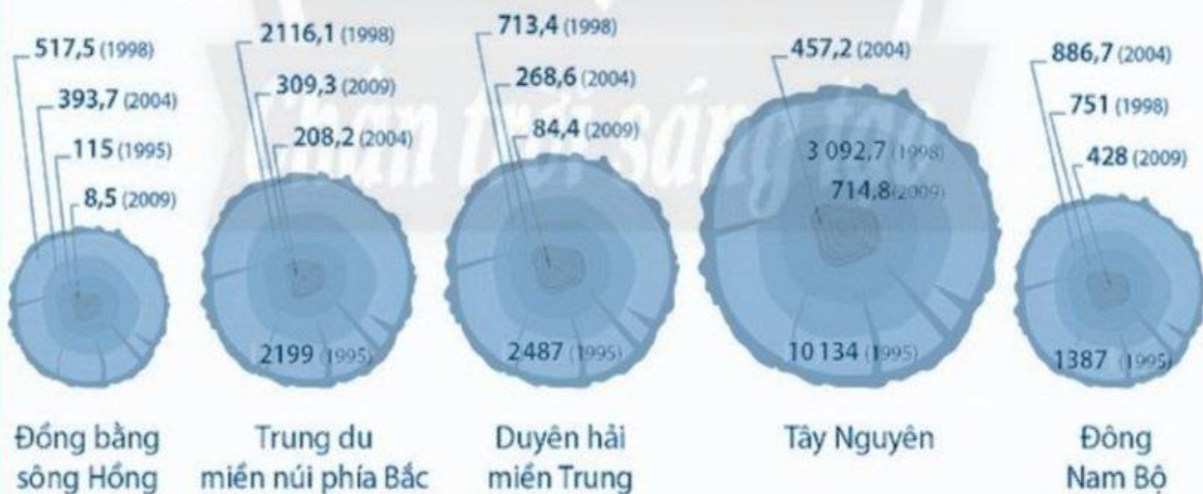
Diện tích rừng Tây Nguyên bị chặt phá nhiều nhất (1995 – 2009) – ha