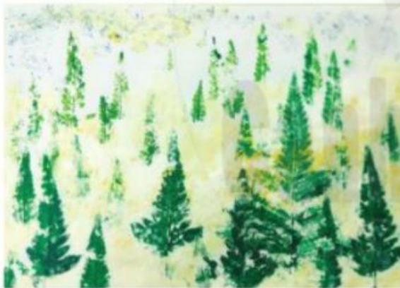
Tranh in lá cây