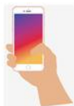
b) Tay bấm điện thoại