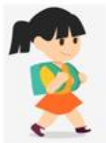
c) Học sinh đeo ba lô