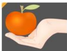
d) Tay cầm quả táo