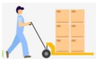
a) Người đẩy xe hàng

Câu 5: Sắp xếp các lực trong các trường hợp sau theo độ lớn tăng dần